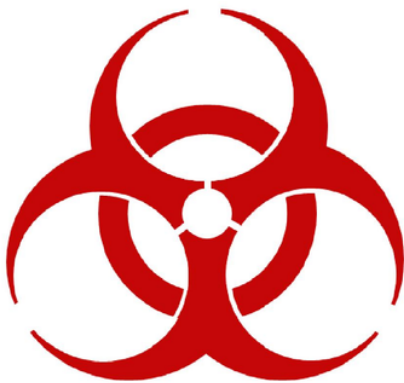
Diseño de Etiqueta

Etiqueta con logo tipo de material biológico. La etiqueta adherida a todos los recolectores tiene reglamentación internacional, diseñada en colores llamativos, facilita a los usuarios la identificación de riesgo con el objetivo de tener mayor control o seguridad.